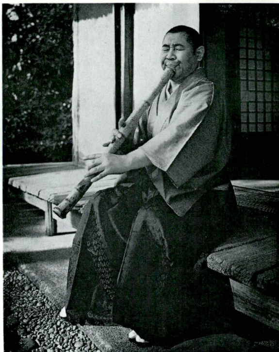
法竹奏者 A Player of the Shakuhachi

序は、外国の人びとからも最も関心をもたれている尺八、するどい迫力と非合理的な音列をもつ尺八の演奏によ