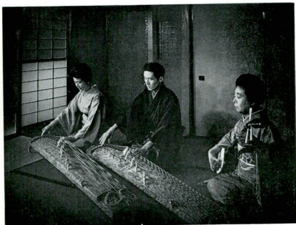
琴と三味線の合奏 The Play of the Koto and the Shamisen

ちょうど、互いのバランスを考えながら個人の幸福を追求して行く日本人の伝統的な生き方と同じように。